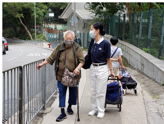
志工協助長者將祝福包帶回家