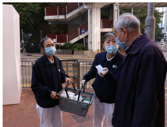
志工向民眾介紹「綠在鯽魚涌」