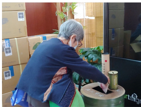
婆婆是打算要留下找回的三百元捐給慈濟資