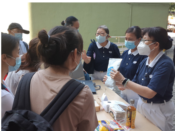
志工向民眾介紹祝福包裡的物資

發放的對象是牛頭角上邨的長者，其中不少帶備了購物小推車或有輪子的背包來裝載祝福包；對拿取有困難的老人家，則由志工協