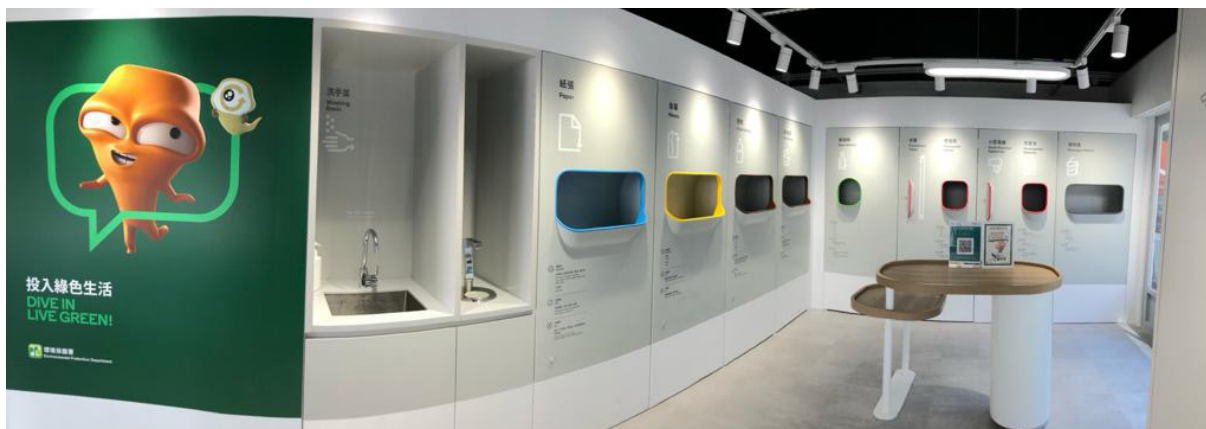
位處東匯坊商場的「綠在鯽魚涌」是第十間投入營運的回收便利店

慈濟感恩有這樣的好因緣為環保付出，會配合政府，更好地推動社區回收，進而達到「環保精質化，清淨在源頭」的目標。