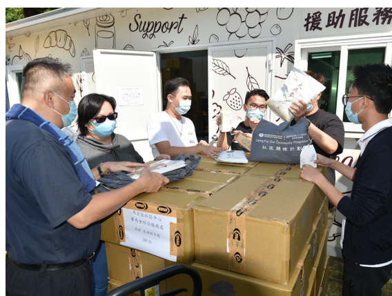
志工與機構職員合和互協整合發放的物資

祝福包也送給了柴灣的一棟樓宇內的 10 戶劏房，他們都是低收入戶，疫情期間開工不足，生活雪上加霜。收到祝福包後，他們皆感謝這份實在的關懷和祝福。