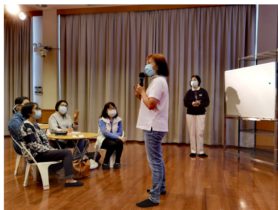
工作坊內容豐富深入，學員獲益良多

參與者對課程一致讚好，認為所教授的理論切實可行。對線上 ZOOM 會議平臺的使用，多位學員表示效果很好，又可互動，使大家更加能夠專注聽課。大家期待教聯會多開設強化志工承擔志業的能力和興趣的課程。