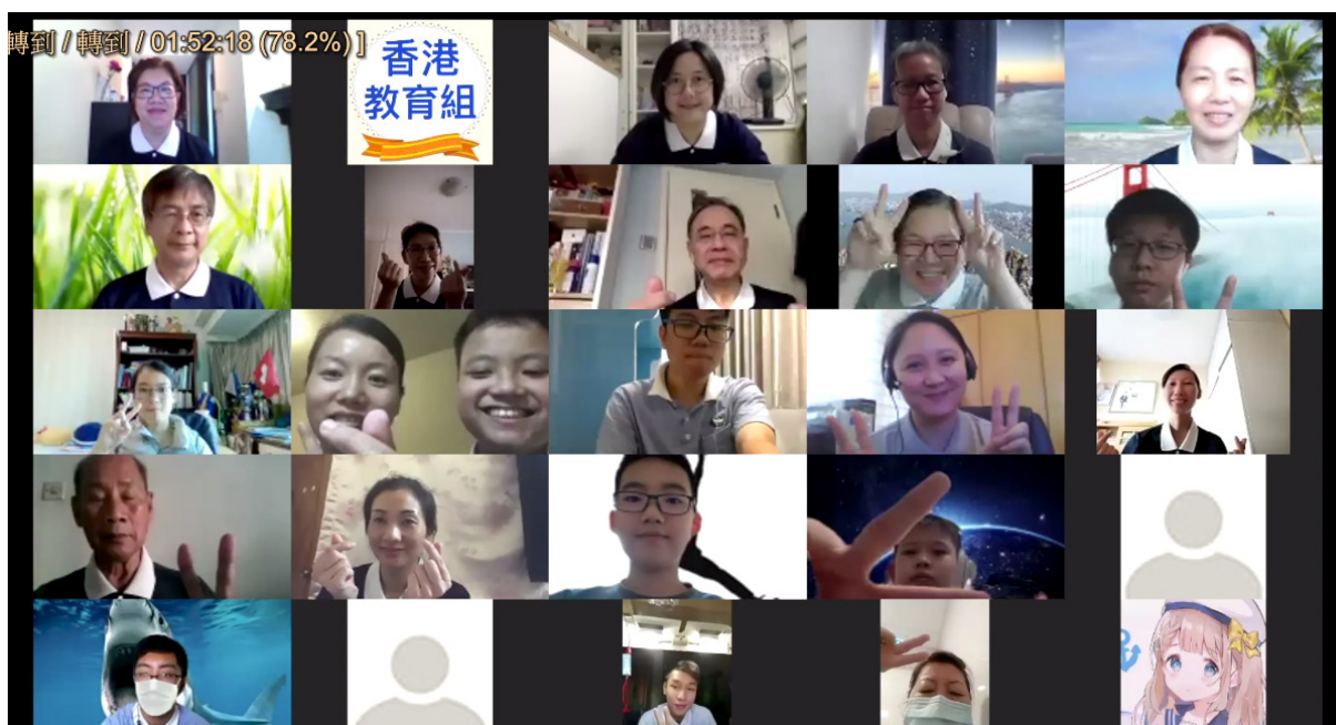
疫情之下運用網路科技，雲端上同聚，相互學習

在對課堂的回饋分享時，學員感恩師姑師伯用心準備課程與陪伴，從中感受到他們的愛與無私的付出。