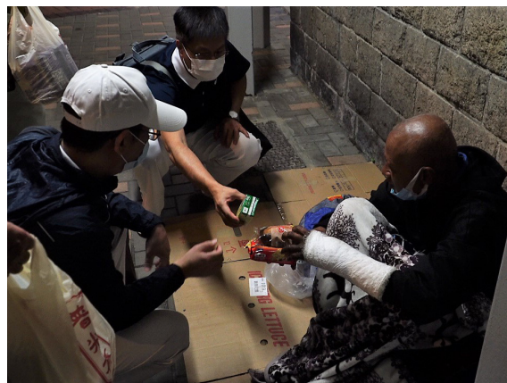
寒冷的夜晚，志工為瑟縮街角的露宿者送上溫暖

「人傷我痛，人苦我悲」，希望在社會暗角被遺忘的這一群，能因志工的慈懷柔腸、持續撫慰關懷，讓他們走出幽谷迎向光明。