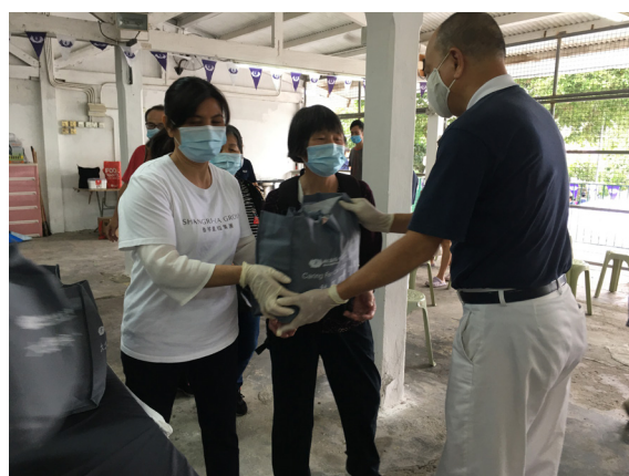
志工與義工誠心送上祝福包