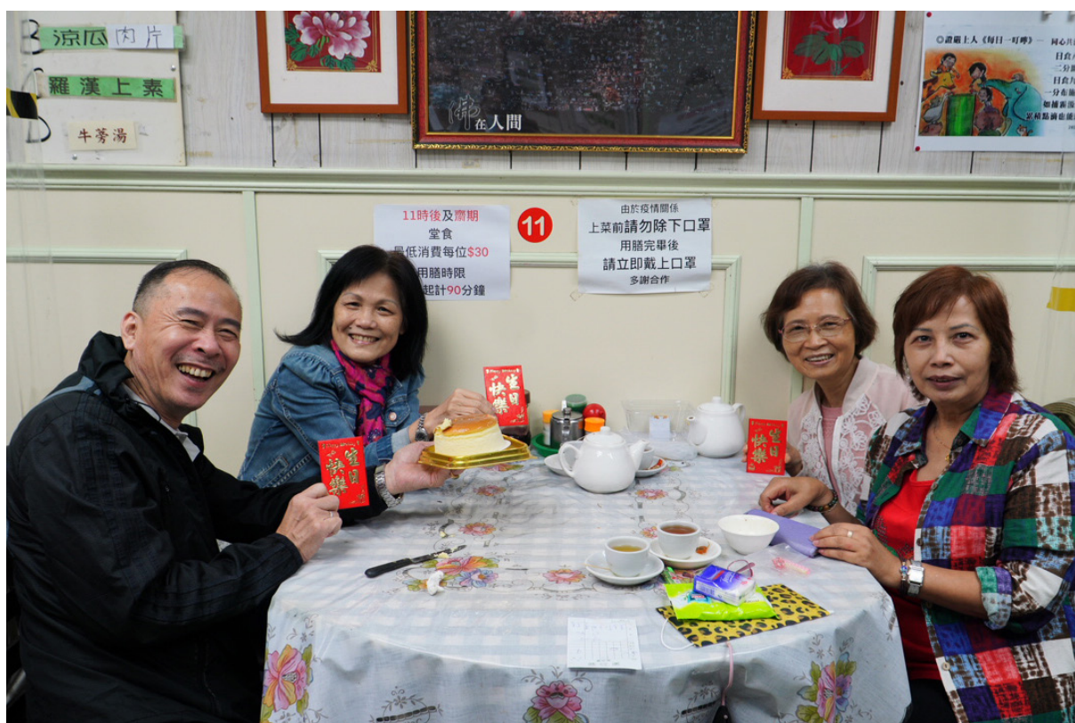
因慶生來用餐的民眾，將生日的祝福化為善款，幫助菲律賓災民