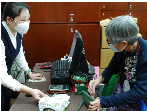
婆婆請購靜思產品時仔細詢問價錢

瘦弱多病的盧婆婆希望慈濟舉辦活動能通知她，如有適合的，她會參加，且還會帶同朋友前來。她離開時，志工陪伴她往港鐵站，並叮嚀她回家的路上要小心。